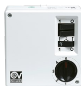
SCNR5 UNIF.X NK SOFFITTO Codice 12955