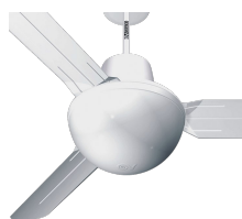
EVOLUTION LIGHT KIT ES Codice 22414