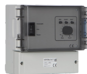
VORT DELTA T Codice 13039