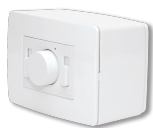
SC EXT B Codice 12803