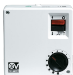
SCRR/M Codice 12965