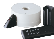
TELENORDIK 5TR Codice 22386