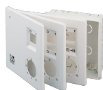
KIT SCB5 (TRASF.5 V.) Codice 22483