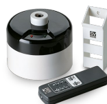
TELENORDIK 5T Codice 22387