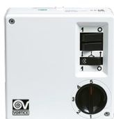
SCNR5 UNIF.X NK SOFFITTO Codice 12955