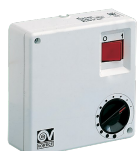
C 2.5 (COMANDO EL. 2.5 A) Codice 12967