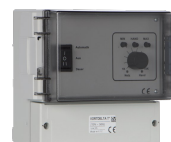
VORT DELTA T Codice 13039