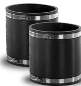
KIT FSG 160 Codice 20213