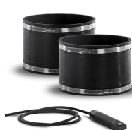
KIT FSG-FLS 160 Codice 20218