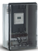
VORT SICURBOX Codice 20204