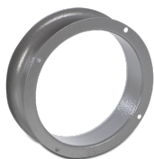
TR-B 10/15 (BOCCAGLIO ASPIRAZIONE)