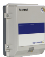
IRET INVERTER 2,5 M Codice 12816