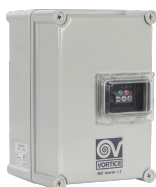
IRET INVERTER 1.2 Codice 12909