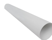
TUBO PVC D.100 L=700 (HRW 30) Codice 21879