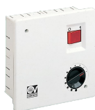
SCNRB I Codice 12971