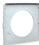
S 150/6 Codice 22156