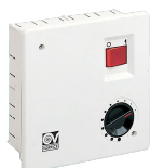
SCNRB I Codice 12971