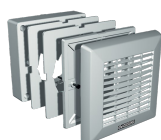
F 150/6" Codice 22133