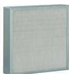
FTR F7 230X250X48 Codice 22628