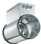
ELECTRIC HEATER 750 Codice 22735