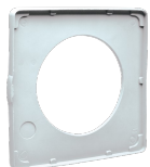
S 100/4 Codice 22154