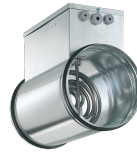
ELECTRIC HEATER 1200 Codice 20317