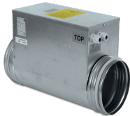
ELECTRIC HEATER 1200 Codice 21622