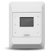
CB LCD D Codice 21381