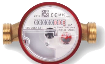
RBM VC (blu)/RBM VH (rosso) WIRELESS

Contatore a getto unico, quadrante asciutto e trasmissione magnetica super dry.