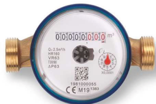
RBM VC (blu)/RBM VH (rosso)