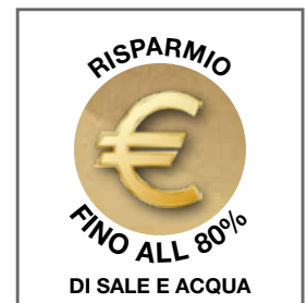
Tecnologia volumetrica doppio proporzionale + funzione vacanza