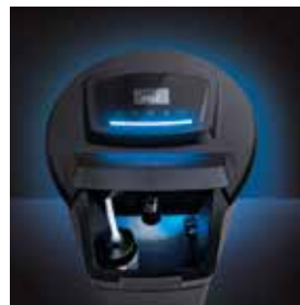
sensore esaurimento sale e doppio led