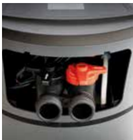
By pass di esclusione impianto

* Massima efficienza del volumetrico e del doppio proporzionale rispetto ad addolcitori tradizionali.