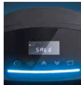
Display LCD a colori con tasti touch screen