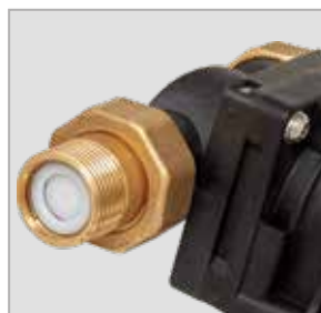
Attacchi ruotabili + valvola di non ritorno

Per la pulizia dell'elemento filtrante è sufficiente aprire lo scarico che attiva il sistema di lavaggio in controcorrente.