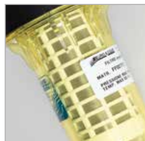
Cartuccia inox effetto ciclone + lavaggio controcorrente