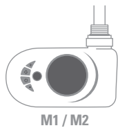
M1 / M2