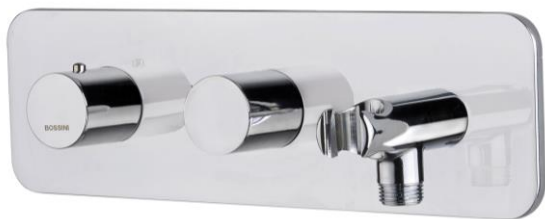
Immagine Prodotto - Product Image

Смеситель терmostатический высокой пропускной способности с девиатором на 2 выхода и держателем с поворотной подключением на 3/4"